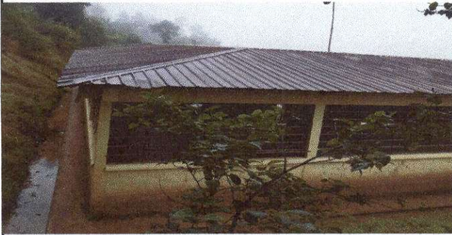
Foto1: Sustitución de lámina, por lámina troquelada aluzinc calibre 26